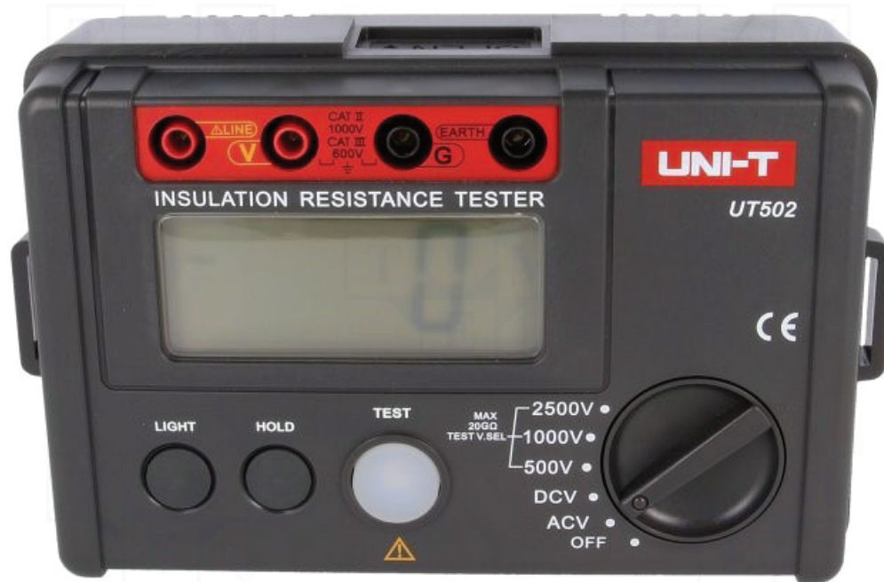
Miernik rezystancji izolacji UT502